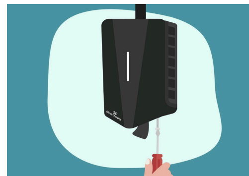
11. Skru på plass skruen fra tidligere. Vipp igjen og lukk gummidelen under.

12. Laderen vil nå koble seg til internett for registrering. Det kan ta litt tid. Du mottar en epost når laderen er tilkoblet og du kan starte å lade.