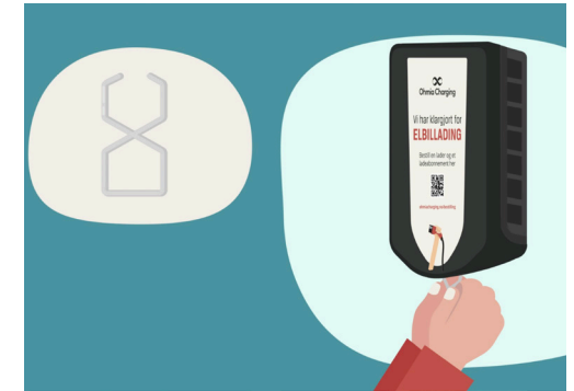
4. Finn frem dekselkroken.