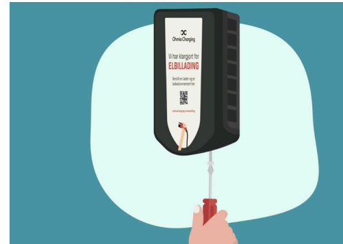
3. Skru opp blinddekslet. Behold skruen!