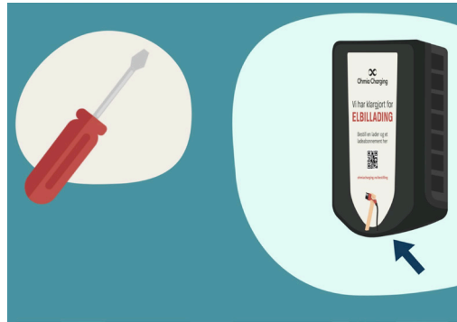
2. Finn frem skrujernet fra pakken.