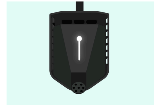
8. Lyset foran på laderen indikerer at den er tilkoblet.