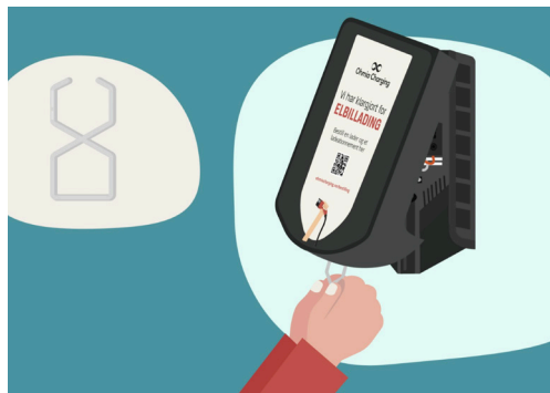
5. Sett dekselkroken i hullene og trekk ned. Ta av dekslet.