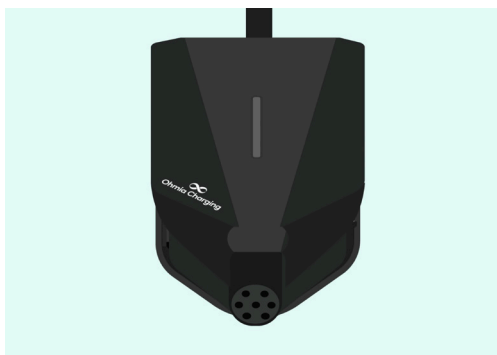
9. Heng frontdekslet i sporet på toppen av bakplata og la det falle på plass.