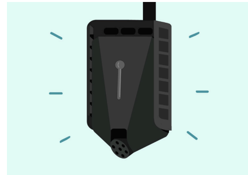
7. Klikk laderen inn og godt ned – du vil høre et tydelig klikk.