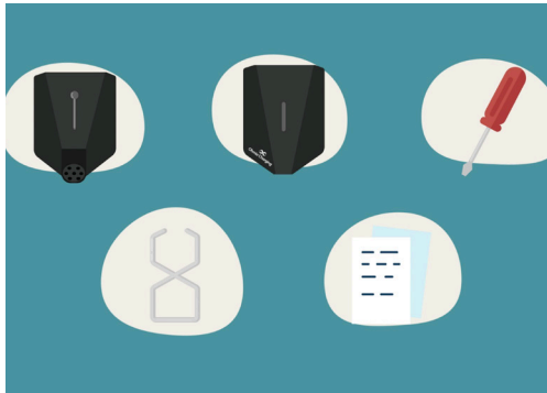
1. Dette ligger i esken.